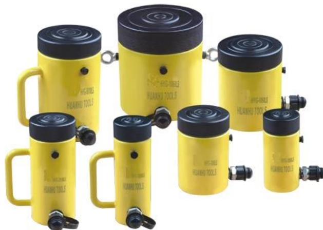
Рис.1 - Домкрат гидравлический с фиксирующей гайкой ННУГ-LS