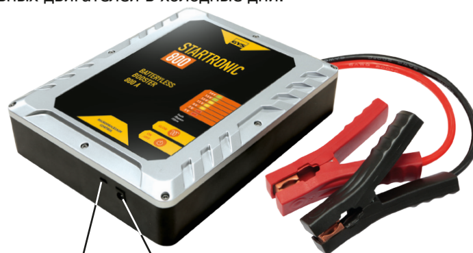
Микро-USB разъем (5В / 2А)